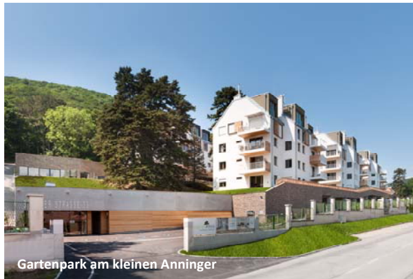
Gartenpark am kleinen Anninger

Die abgebildeten Projektfotos dienen als Ansicht. Um diese für weitere Zwecke zu verwenden bzw. hochauflösend zu erhalten, bitten wir um Kontaktaufnahme. Vielen Dank!